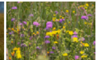
De første år